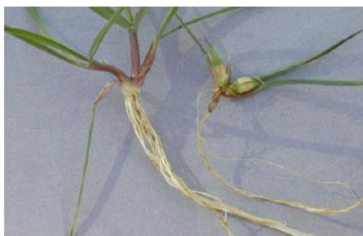
1 maand na toepassing : zwellen van de wortelhals