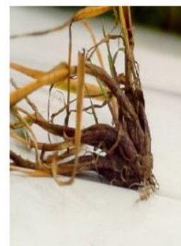
2 maand na toepassing

Advies: AZ 0.75 – 1 l/ha + KERB SC 1.75-2.5 l/ha