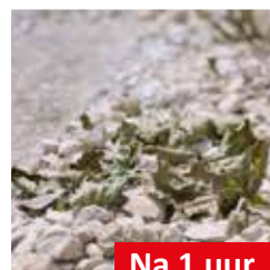
Na 1 uur