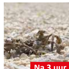
Na 3 uur